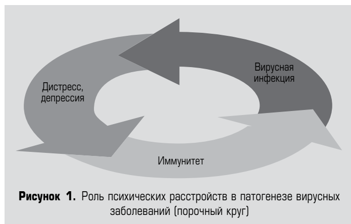
Рисунок 1. Роль психических расстройств в патогенезе вирусных заболеваний (порочный круг)

Во-первых, среди непосредственных эффектов инфекции установлено, что коронавирус оказывает прямое воздействие на ЦНС и способен повреждать нейроны, астроциты, перициты и глиальные клетки, что может привести к развитию коронавирусного энцефалита [28, 30]. В одной из работ высказывается предположение о том, что когнитивные нару-